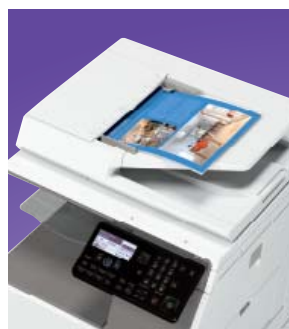
Scansione di rete full colour