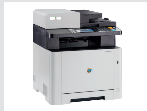
Design compatto ed elegante