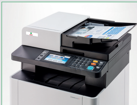
Alimentatore automatico Dual-scan