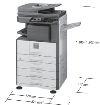
*1.085 mm con vassoio di uscita esteso. Modello con opzioni.